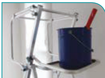
OPTION : tablette peinture pour fût 15 L.