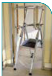
Passe les portes de 0,63 m.